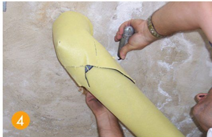
Medir y cortar Quitar papel antiadherente Adherir al tubo Duplicar en la curva